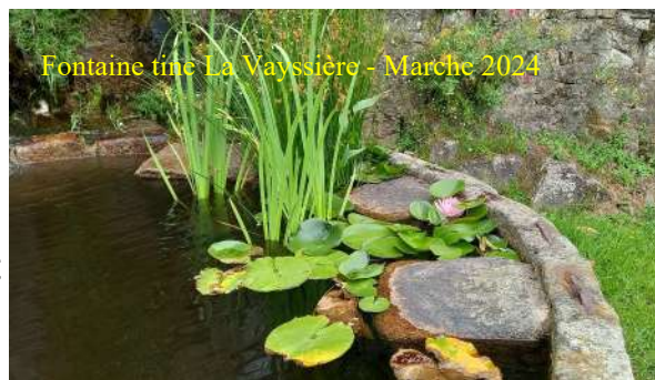
Fontaine tîne La Vayssièrre - Marche 2024

Pour nous contacter : Téléphone 05 63 74 05 49 - Courriel: secretariat@mprl.fr